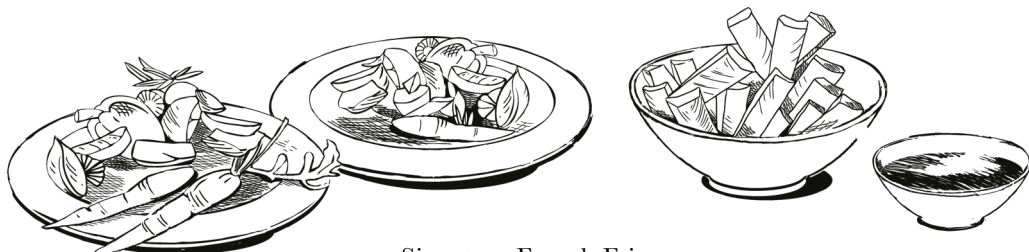
Signature French Fries, Baked Potato & Sour Cream oder Gemüsebeilage | 5 p.P. Chimichurri Sauce inkl.