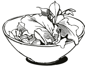
Salat | 10 p.P.