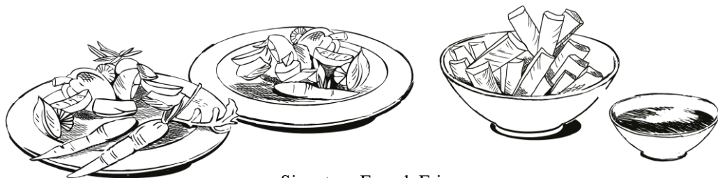
Signature French Fries, Baked Potato & Sour Cream oder Gemüsebeilage | 5.- p.P. Chimichurri Sauce inkl.